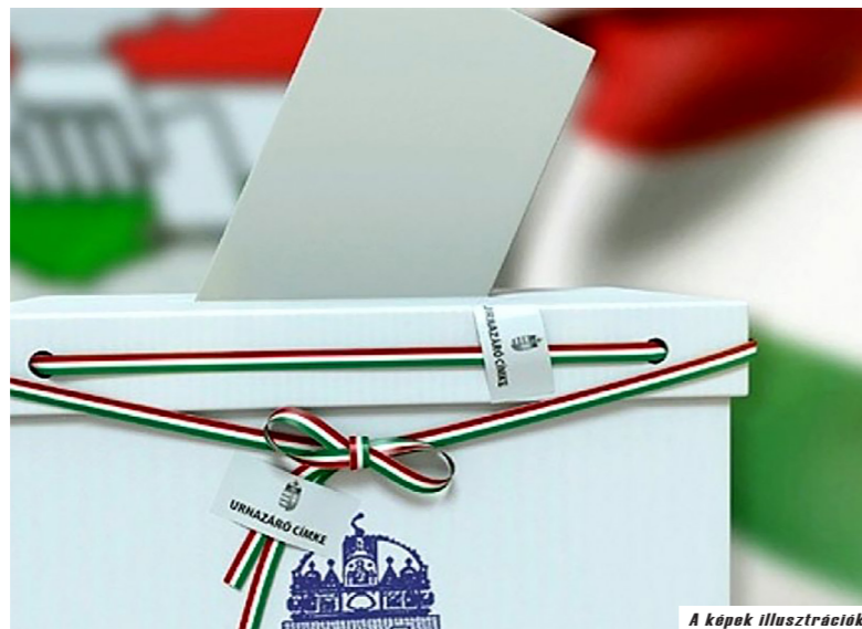
A képek illusztrációk

A kérelmet beviheti hozzátartozó vagy más meghatalmazott, de elektronikusban is be lehet nyújtani. Személyesen április 10-én, pénteken 16 óráig lehet be-