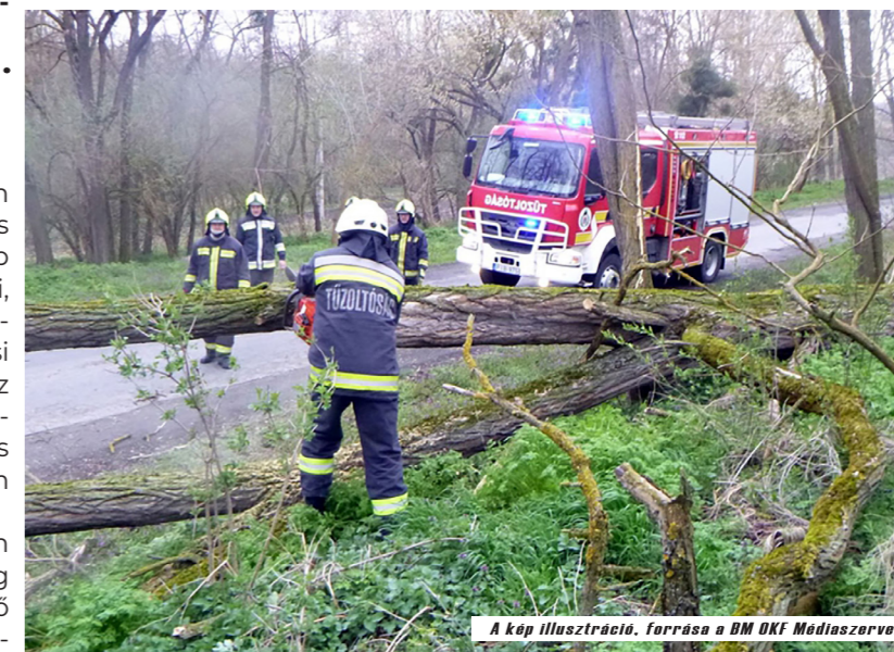
A kép illusztráció.

oltók leszedték. Több helyen útra dőlt fa adott munkát a kivezényelt tűzoltóknak, akik rendre sikerrel birkóztak meg a feladattal.