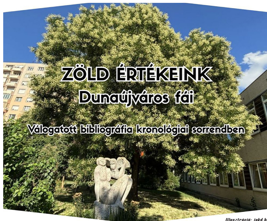
Illusztráció: Jákó. hu

Zöld értékeink védelme aktuálisabb feladat, mint valaha – mindenkit szeretettel várnak az előadásra!